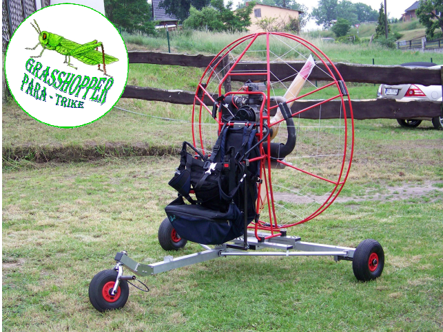
Achse mit Haupträdern, Homanschluss und der hinteren Motoraufnahmetraverse (Räder sind ebenfalls entfernbar)