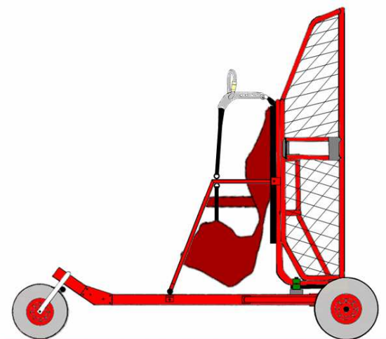
Grasshopper mit Fresh – Breeze Simonini

So wiegt das Trike für den Rucksackmotor „Fly Castelluccio“ beispielsweise insgesamt nur 14,4 kg und das Packmaß des Sitz- / Tragbügels ist ebenfalls wesentlich geringer.